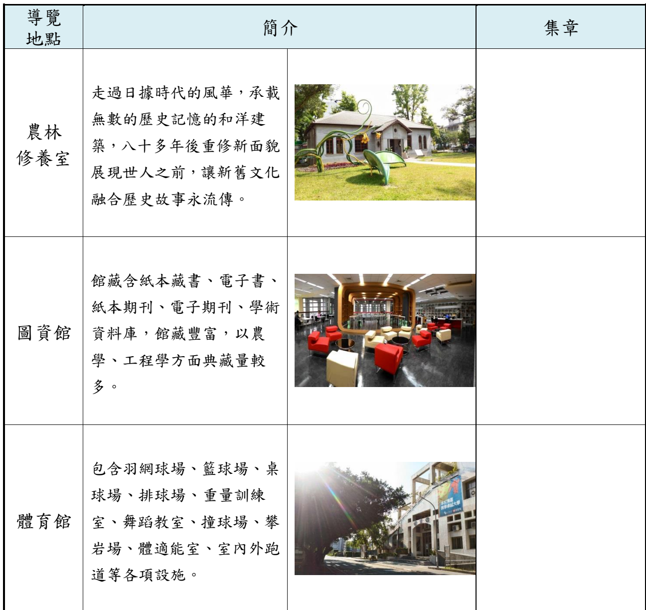
宜蘭大學校園導覽圖

本校於口試當日9:00至15:00安排農林修養室、圖資館及體育館三個定點進行解說導覽，完成三處導覽，可集章並至總服務台兌獎，文青風12色鉛筆送給您（一人限領一組），歡迎踴躍參加！